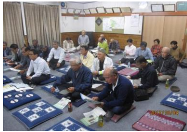
10/4 根小屋町第一公民館