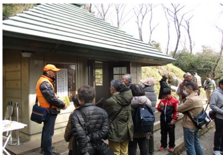
3/11 一般公開で賑わう山上碑