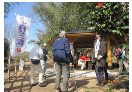
3/24 山上碑あずま屋での案内活動