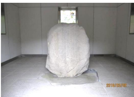
3/9 一般公開された金井沢碑