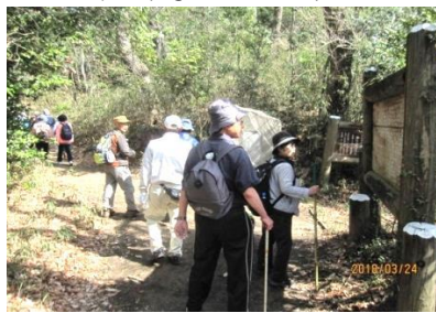
山名城址入口付近