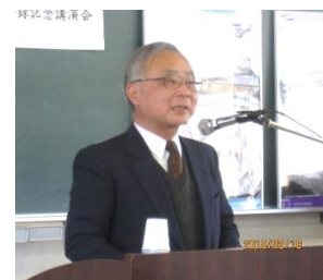
2018年 旧南八幡公民館での講演